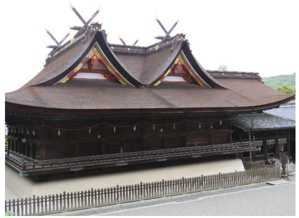
吉備津彦神社の本殿

岡山県の伝承ではすでに述べたように桃太郎話は温羅伝説から発生したというのが通説だ。本稿「温羅伝説を考える（上）（中）」を通じて述べてきたのは「温羅伝承は室町中期に神仏習合の中から誕生した」との結論だ。それからすれば、前項で述べた「桃太郎の室町時代起源説」とは矛盾なくつながるように思う。