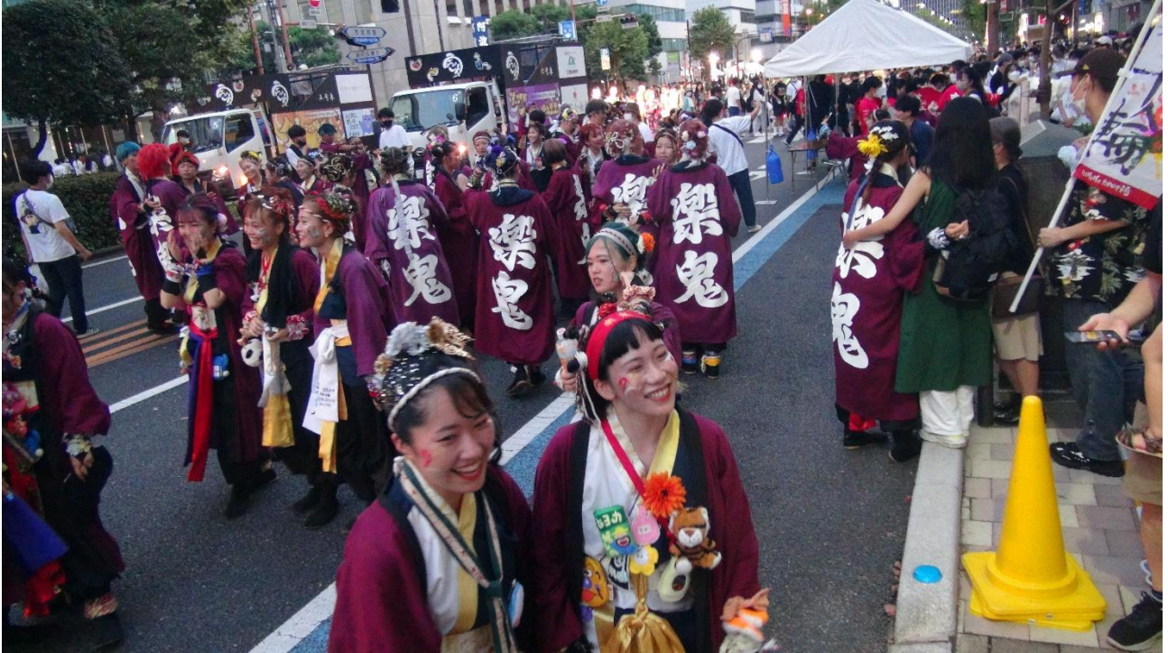
3年ぶりに開かれたおかやま桃太郎まつり。うらじゃ踊りを楽しむ若者たち＝令和4年8月21日

平成6年（1994年）に岡山商工会議所青年部の発案で「うらじゃ祭」が始まった。温羅にはもう悪党の面影はなく、ソーラン節やよさこい祭りのように、派手な衣装で踊り狂う若者のたちでにぎわっている。新型コロナの影響で2年間中止となっていたが今年から