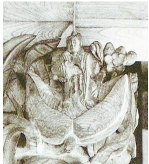
敦賀空襲で焼失した旧本殿に飾られていた着衣の桃太郎といわれる彫像

同神宮の 9 末社の一つに「擬領神社」がある。御祭神は建功狭日命である。別伝に大美屋都古神とも、玉佐々良彦命ともいわれる。建功狭日命は「先代旧事本紀」に角鹿国造祖と記されている人物である。この建功狭日命は、吉備武彦命の子である。またこの神宮の御祭神の一柱である日本武尊の妃・吉備穴戸