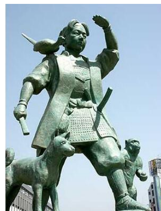
岡山駅東口にある 桃太郎の像

桃太郎の話は全国的に広がる？ 『日本昔話事典』の『ももたろう 桃太郎』の項目には桃太郎は明治時代になっては、国定教科書にも採用されて画一化されたが、地方には異なった型の『桃太郎』も伝承されている。東北・北陸地方では桃が箱に入って流れてくるところがある。また、桃は登場せず、川で拾った箱を開けると小さい子どもがいると説く例もある（新潟）。また、話の展開の部分には変形が多く、『猿蟹合戦』『雁取り爺』『物くさ太郎』『隣の寝太郎』を思わせる話を含む例もある。石川県には『絵姿女房』や『力太郎』と結びついた桃太郎異譚もある。（中略）『野村純一著作集 第3巻 桃太郎と鬼』の中には、福島県・能登半島・南加賀・新潟県・西讃岐・徳島県・岡山県新見市神郷町・山陰地方の桃太郎話や異譚が紹介されている」（岡山県立図書館レファレンス）（註1）